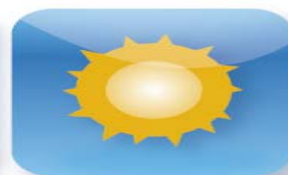
Maximální výnos 55%

Seznamte se s chytrým nástupcem moderních spořicíh produktů, který v sobě zahrnuje výhody: