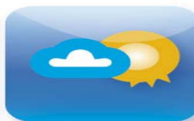
Ochrana vložené investice

Zajištěný fond v CZK se 100% návratností investice při splatnosti fondu s možností dosáhnout výnosu až 55 % .