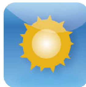
Neomezený maximální výnos

Před splatností můžete nakoupit i zpětně odprodat podíl ve fondu za cenu odpovídající podílu na čisté hodnotě vlastního kapitálu fondu, a to vždy 2x měsíčně.