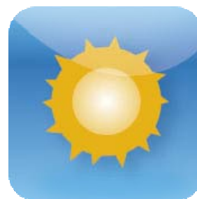
Neomezený maximální výnos

Před splatností můžete nakoupit i zpětně odprodat podíl ve fondu za cenu odpovídající podílu na čisté hodnotě vlastního kapitálu fondu, a to vždy 2x měsíčně.