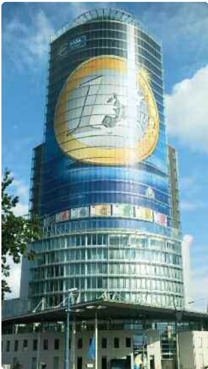
Národní banka Slovenska v Bratislavě

První leden 2009 vstoupí do slovenské historie jako den, kdy u našich sousedů bylo zavedeno euro. I v ekonomické oblasti tak úspěšně završí své dlouholeté úsilí o osamostatnění a zplnoprávnění ve vyspělé Evropě. Cesta od slovenské koruny k euru nebyla vždy prosta rizik a otřesů, vcelku však můžeme říci, že Slovensko vplulo do eurozóny v dobré formě a s jistou „výkonnostní rezervou“. Na zodpovězení otázky, jak silný inflační impulz přinese euro slovenské ekonomice a co bude pro ni znamenat rezignace na samostatnou měnovou politiku, si budeme muset ještě nějaký čas počkat. Pokusme se nyní alespoň zamyslet nad tím, jaké důsledky může mít zavedení eura na Slovensku pro českou ekonomiku. Pracovně můžeme důsledky slovenského přijetí eura rozdělit na přímé a nepřímé. Sílu přímých důsledků lze odhadnout mj. z relativní velikosti české a slovenské ekonomiky a z intenzity jejich ekonomické provázanosti. Přečod na společnou evropskou měnu jistě zvýší v očích zahraničních ekonomických subjektů kredibilitu Slovenska. Pro řadu investorů i obchodníků se stane minulostí nebo