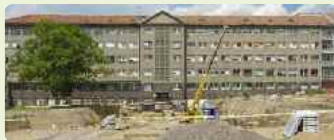
Rekonstrukce příbramské nemocnice se již rozbíhá

e-mail: jtrojak@csob.cz, tel.: 224 114 367