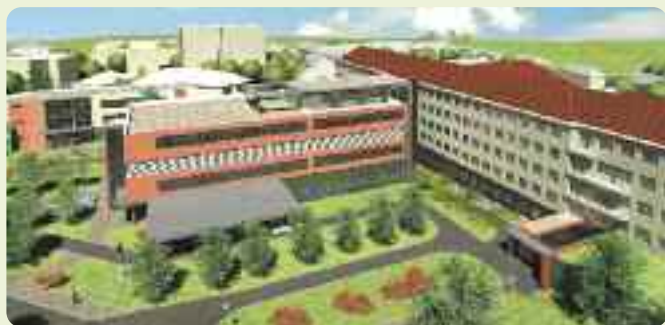
Přestavba Oblastní nemocnice Příbram, a. s., bude financovaná z úvěrů, které nemocnice získala i díky poradenství ČSOB

Při financování komplexních případů se ČSOB snaží s klienty spolupracovat zcela přirozeně již od počátku. Konečná struktura financování tak vzniká v úzké spolupráci banky a klienta. Pokud je financování poptávané prostřednictvím veřejného výběrového řízení, jsou možnosti diskuse a vyjednávání klienta s finančními institucemi velmi omezené. Nejčastěji využívané otevřené řízení je sice nejtransparentnější, ale neumožňuje upravovat podmínky poptávky podle reakce trhu. Zadavatel tedy potřebuje nalézt přiměřenou strukturu a podmínky financování ještě před vypsaním výběrového řízení. Jelikož sám pravidelně nepracuje s finančním trhem, je vhodné, aby si u větších objemů najal zkušeného poradce.