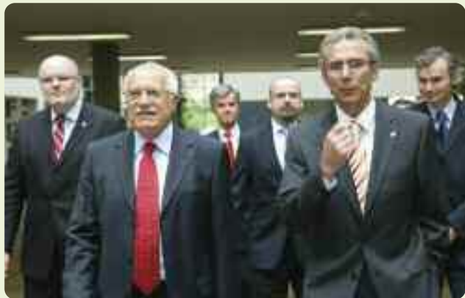
Nové ústředí ČSOB v Praze-Radlicích navštívil letos v květnu i prezident České republiky Václav Klaus. „Přeji vám, aby pro vás tato výjimečná budova byla neustálým zdrojem inspirace,“ uvedl při své návštěvě prezident.

jednoho ze čtyř ocenění – certifikovaný, stříbrný, zlatý a platinový. Pokud stavba získá zlatý certifikát LEED, znamená to, že je o polovinu šetrnější k životnímu prostředí než klasická budova. Nové ústředí ČSOB je již držitelem titulu Stavba roku 2007 a letos získalo také hlavní cenu v již patnáctém ročníku soutěžní přehlídky Grand Prix architektů. Současně autoři budovy ČSOB ve stejné soutěži dostali i Čestné uznání od Ministerstva životního prostředí ČR.